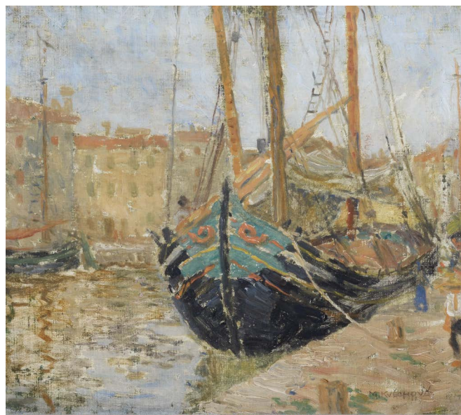
Loď v přístavu, Grado, 1912